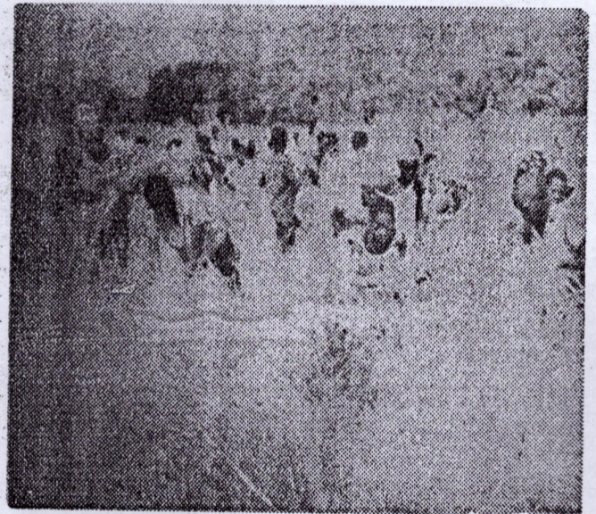
Les élèves d'un CER dans un champ de riz à Koundara.

premiers biens de consommation de l'homme, Siguiri, c'est cette terre juteuse où pousse le riz comme jamais ailleurs, c'est cette terre généreuse qui récompense avec prodigalité les durs efforts du cultivateur.